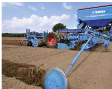
Маркер с болтовой защитой на срез

Гидравлические маркеры расположены спереди и поэтому всегда находятся в поле зрения водителя.