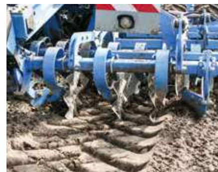
Диски для следорыхления

На легких и рыхлых почвах рекомендуется использовать рабочие органы для рыхления следов транспортного средства. Диски для следорыхления для всех складываемых комбинаций Compact-Solitair позволяют надежно убрать все следы от колес.