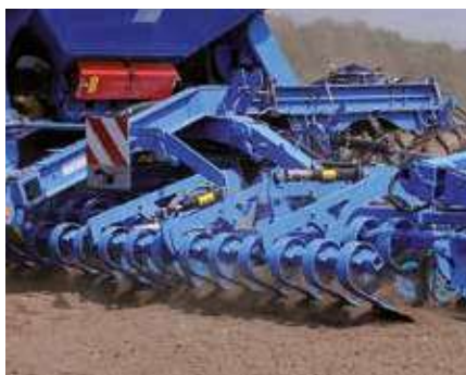
Подпружиненные выравнивающие стойки

При применении Компакт-Солитера по вспашке рекомендуется использовать гидравлически регулируемые выравнивающие стойки.